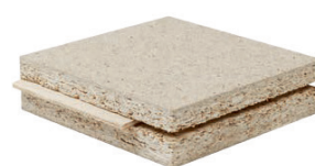
VSF Aggloméré assemblage rainure et languette