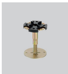
Typ 4 Vérins individuels en 1 pièce jusqu'à 200 mm