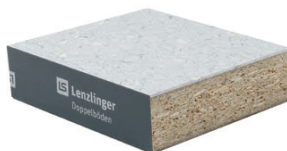
PSB Aggloméré face inférieure avec tôle d'acier