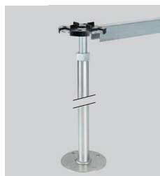
Typ 6 Vérins individuels avec traverses légères