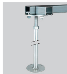
Typ 8 Construction avec profilés vissés