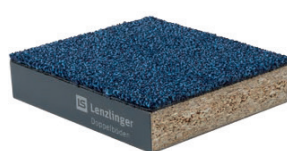
DSB Aggloméré panneau mince < 30 mm