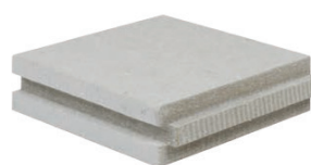
VMO Fibre minérale assemblage rainure et crêté