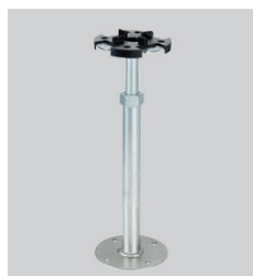
Typ 5 Vérins individuels en 2 pièces à partir de 200 mm