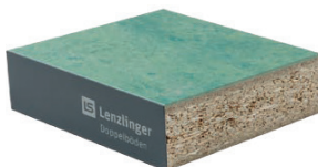
PSF Aggloméré face inférieure avec feuille d'aluminium