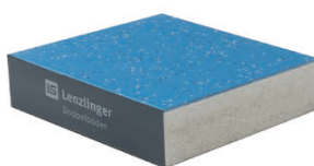
PMB Fibre minérale face inférieure avec tôle d'acier